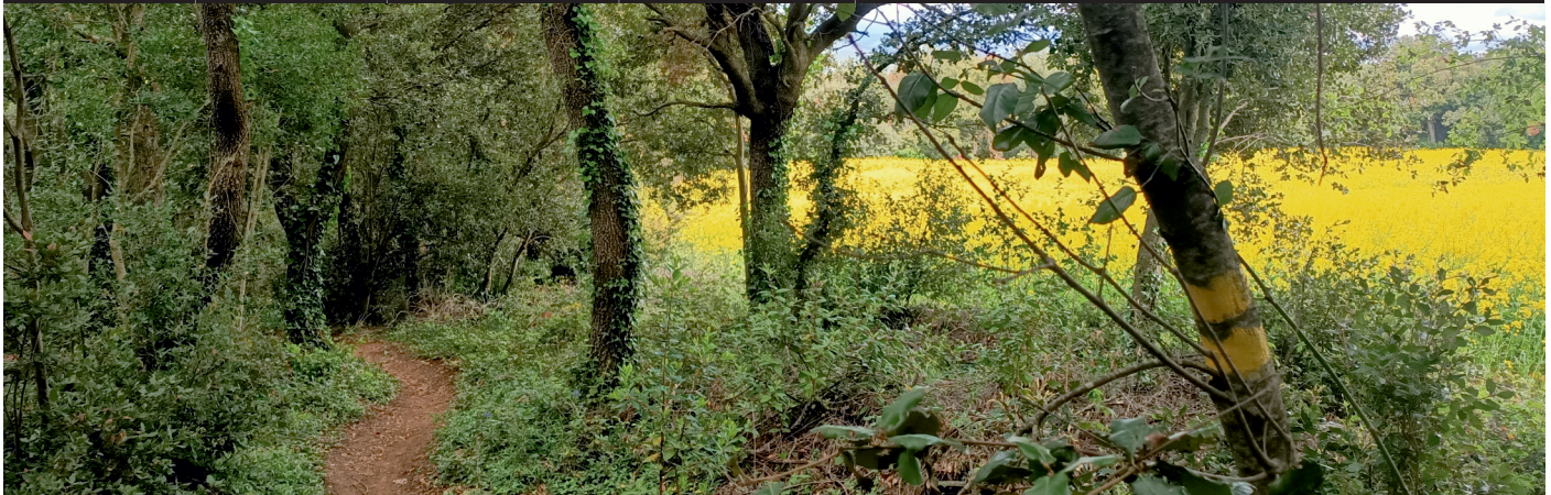
Descripción de la ruta / Ibilbidearen deskribapena