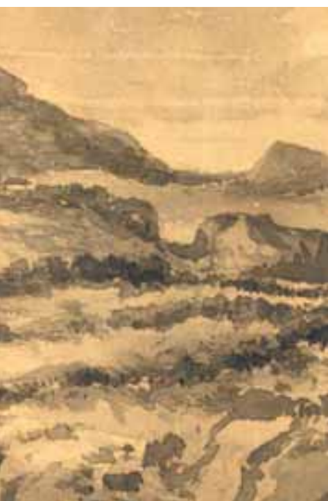
geográfico del Ejército).

bía combatido junto al guerrillero Rosas Samaniego en la tercera guerra carlista. Al término de esta, Jergón fue acusado de "asesinar sin piedad, ni temor de Dios a jóvenes de 15 y 18 años, hombres en la mejor edad de su vida, ancianos casi decrepitos, y a doncellas de 22 años, sepultándolas en los insondables abismos de la sima de Igúzquiza, unas veces después de muertas, otras mal heridas y otras vivas, sin más motivo que leves sospechas de que eran de opinión liberal o que habían conducido algún parte".