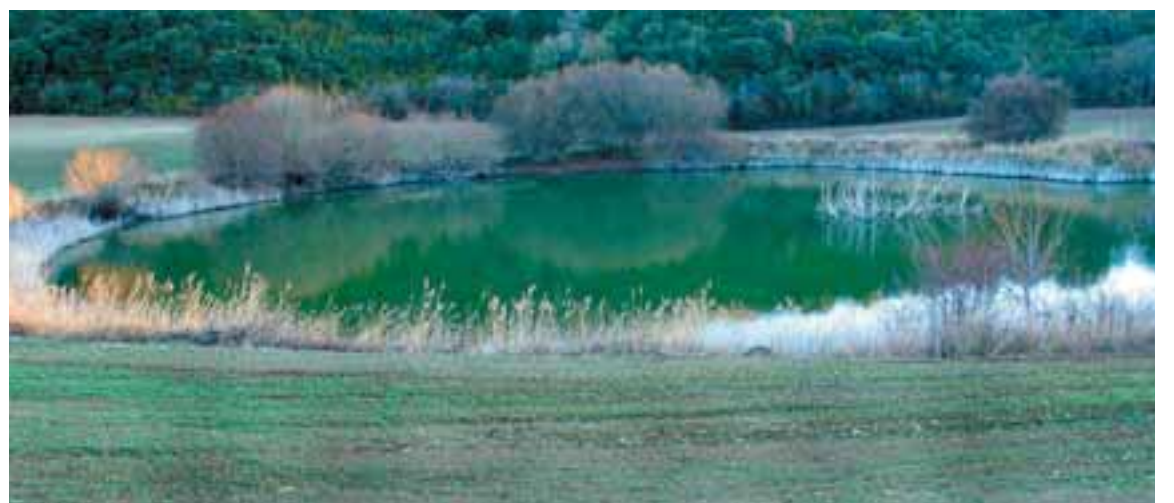
El pozo de Igúzquiza tiene 50 metros de diámetro

Esta última se hizo famosa a finales del siglo XIX por las baladronadas de un soldado carlista, apodado Jergón, que se jactaba de haber arrojado allí a varias personas de ideología liberal. Aquel personaje se llamaba en realidad Ezequiel Lorente, y ha-