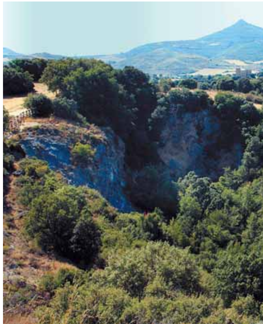
Imagen actual de la sima de Igúzquiza. La boca se encuentra hoy cubierta por la ve