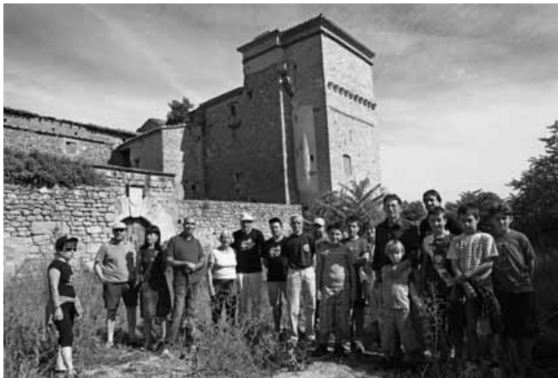
La jornada comenzó con una visita guiada al palacio de Igúzquiza, que interesó a adultos y niños.

ción de la misa, el número de congregados comenzó a aumentar, mientras los más pequeños se divertían con los hinchables. El momento cumbre llegó antes